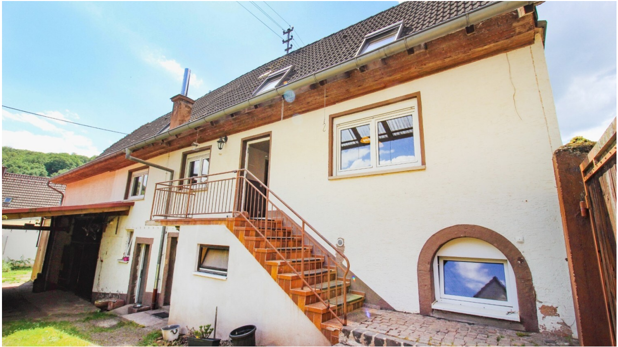
Ansicht Haus Hof