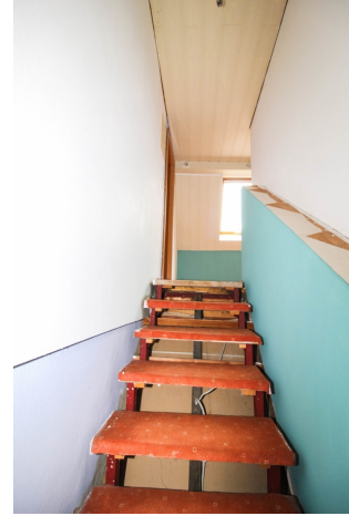
Treppenhaus ins OG