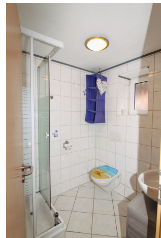
EG_Gäste-WC mit Dusche