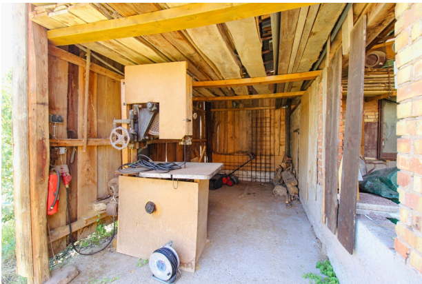
Scheunen im Außenbereich (3)