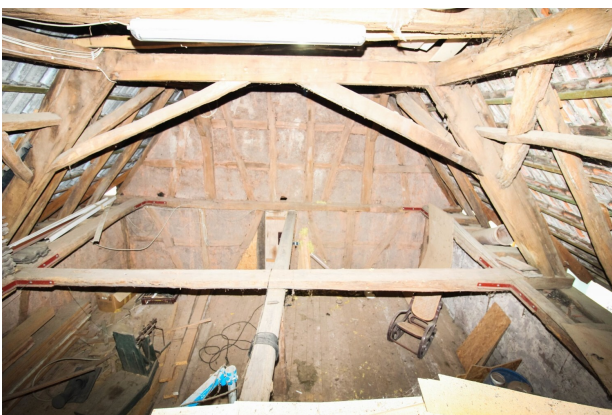
OG_Ausbaureserve über der Scheune