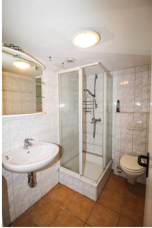
Keller_WC mit Dusche