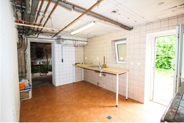
Keller_Waschküche mit Zugang zum Hof