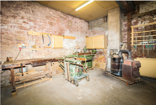
Scheune_Schreinerwerkstatt mit Maschinen (4)