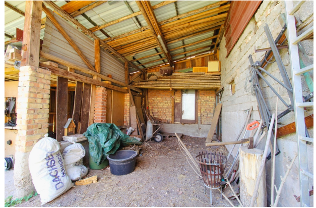
Scheunen im Außenbereich (2)