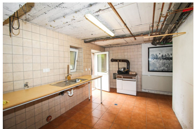
Keller_Waschküche mit Zugang zum Hof