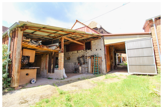
Scheunen im Außenbereich (4)