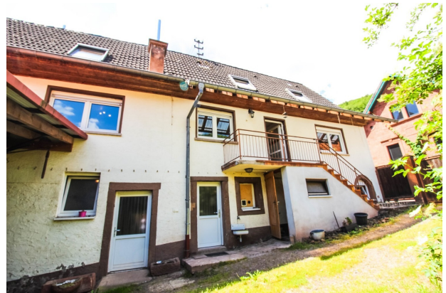
Ansicht Haus Hof