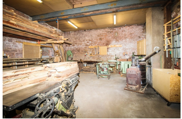
Scheune_Schreinerwerkstatt mit Maschinen (2)