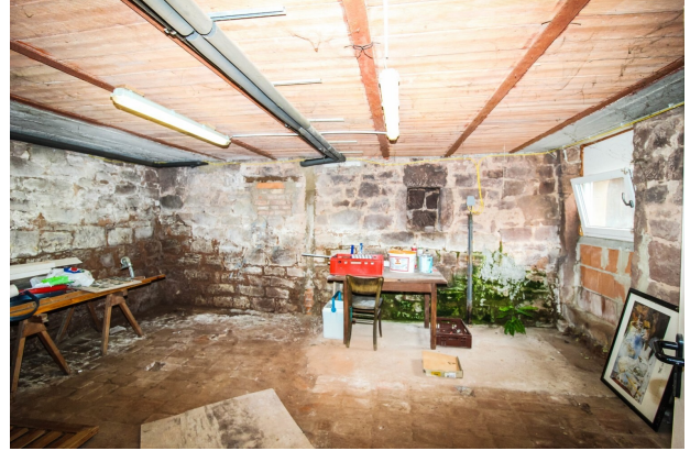
Kellerraum mit Natursteinboden