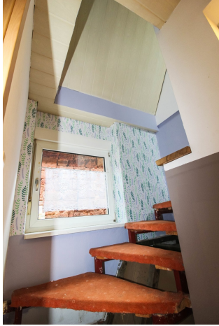
EG_Treppenhaus ins OG