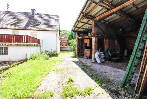
Scheunen im Außenbereich (1)