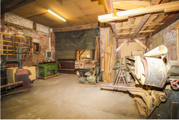
Scheune_Schreinerwerkstatt mit Maschinen (1)