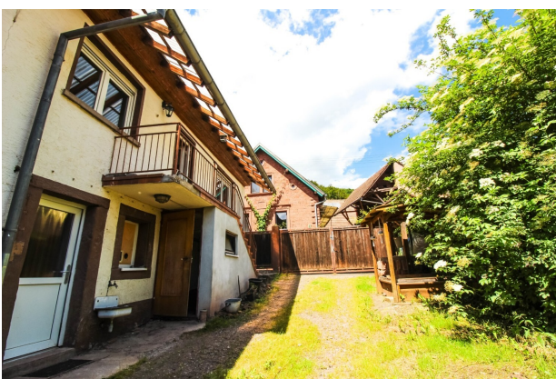
Ansicht Haus Hof