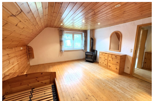
DG_Schlafzimmer (3) (Benutzerdefiniert)