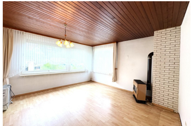
EG_Wohnzimmer (1) (Benutzerdefiniert)