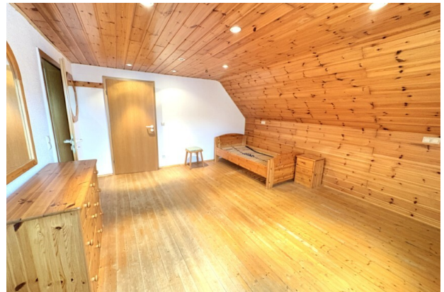
DG_Schlafzimmer (1) (Benutzerdefiniert)