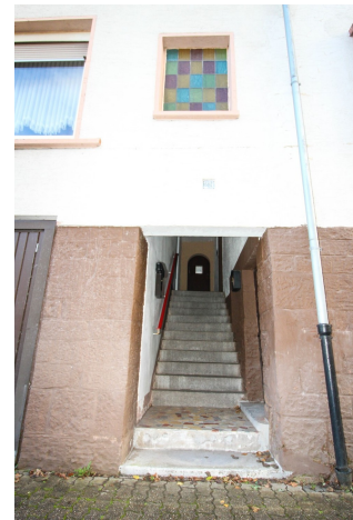
Außen Treppenaufgang (1)