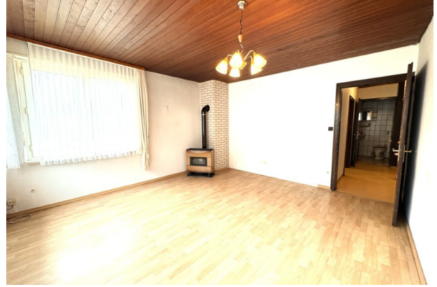
EG_Wohnzimmer (3) (Benutzerdefiniert)