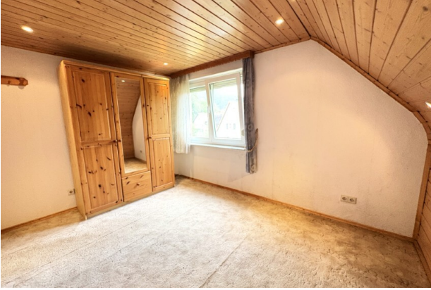
OG_Kinderzimmer (1) (Benutzerdefiniert)