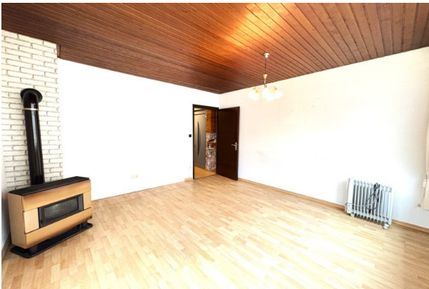
EG_Wohnzimmer (2) (Benutzerdefiniert)