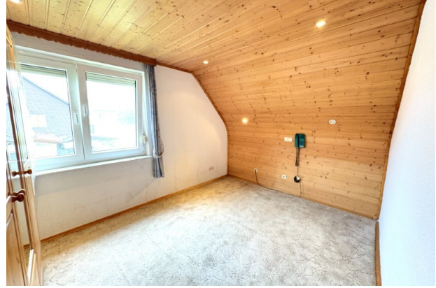
OG_Kinderzimmer (2) (Benutzerdefiniert)