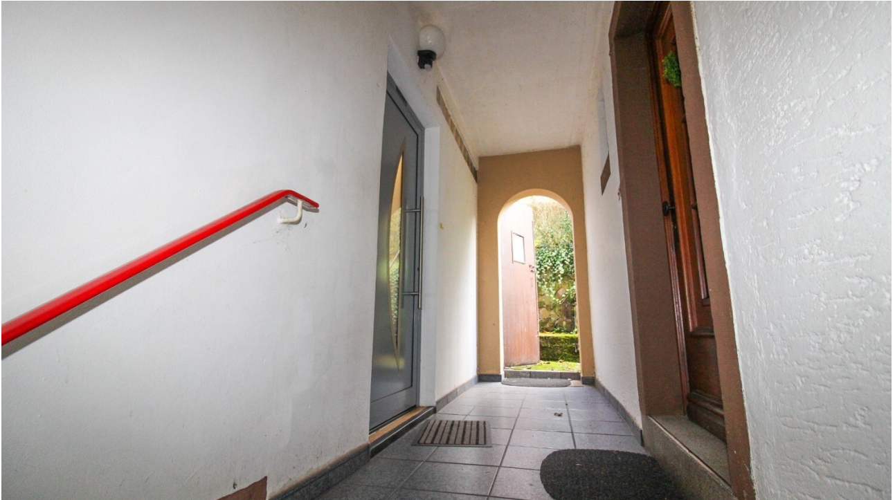
Außen Treppenaufgang (3)