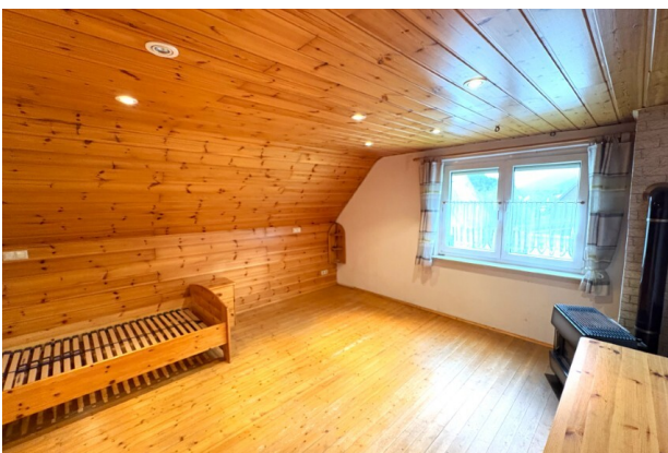
DG_Schlafzimmer (2) (Benutzerdefiniert)