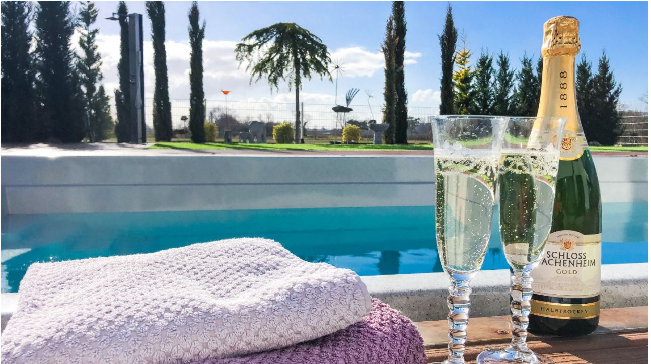
Außen Sekt (2)