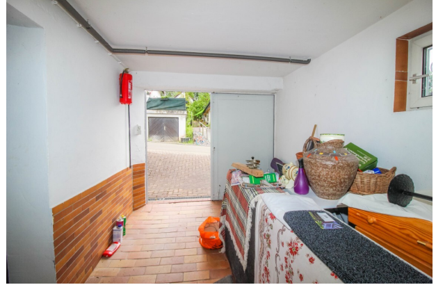
Keller_Garage im Haus